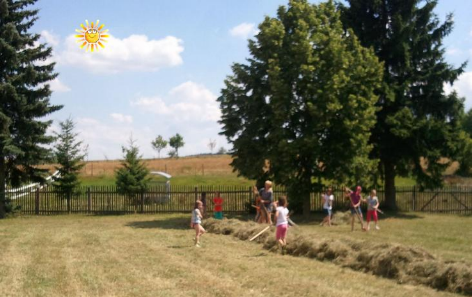
Heurechen mit Hoppel